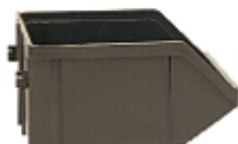
Art. B07 Trasparente/ Trasparente/ Trasparente (box n.40)