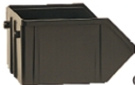
Art. B07/G Trasparente/ Trasparente/ Trasparente (box n.20)