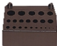
Art. B12 (box n.40)